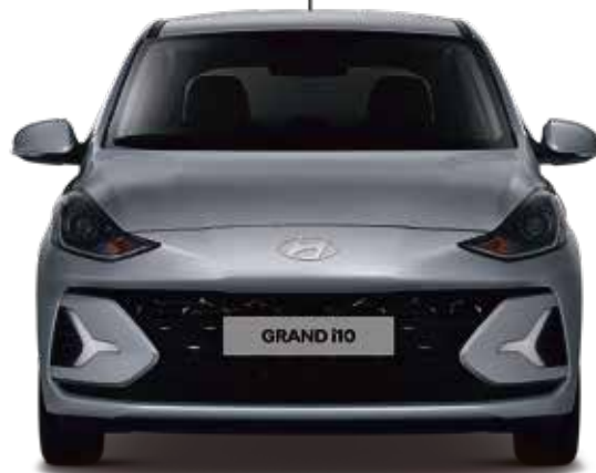
Plata Ciclón Metalizado