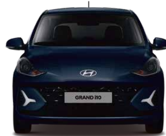
Azul Medianoche Perlado